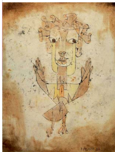
Angelus Novus, Paul Klee (1920). Tinta china, tiza y acuarela sobre papel. Inspirador del "ángel de la historia" de Benjamin y, en cierto modo, santo patrón de este trabajo de investigación.