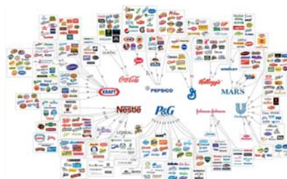
The illusion of choice.

Construido cada ciclo como oposición al inmediato interior, la repetición reiterada de los mismos produce ciertas reincidencias, ciertos efectos de déjà vu que el esquema de conclusiones permite hacer aflorar. Las conclusiones indagan someramente en algunos de estos deslizamientos, cuyo más incisivo análisis bien podría constituir una nueva investigación en sí misma.