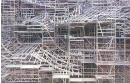
Andamio de las bodegas Marques de Riscal de Gehry.