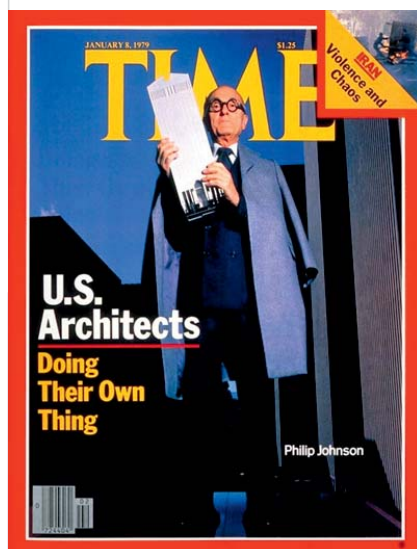
Portada de la revista Time. 8 de enero de 1979.