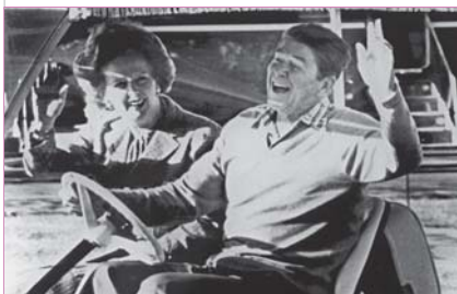
Thatcher y Reagan.