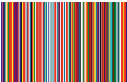
Código de barras europeo, diseñado por OMA.