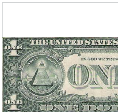
El ojo de la pirámide en el dólar americano.

Se tratará, pues de trazar una línea discursiva que, evitando pretensiones holísticas o globalizadoras, permita una argumentación sólida y una contextualización de la producción arquitectónica en su entorno socio-económico tardocapitalista. La incidencia en este campo relacional poco explotado en la crítica arquitectónica debe proporcionar nuevos datos y perspectivas originales a la interpretación del pasado reciente y a nuestra posición frente al futuro inmediato.