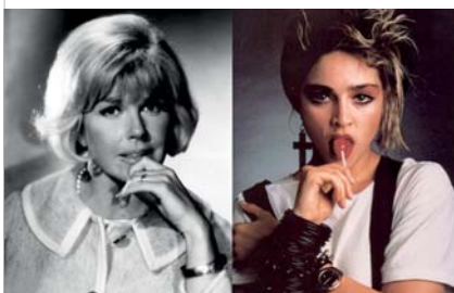
Doris Day/Madonna, musas de fordismo y postfordismo