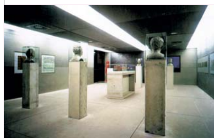
Exposición de proyectos para Postdammerplatz. Berlin