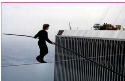
World Trade Center, Philippe Petit (1974) http://www.moviesaboutgladiators.com/2011/07/man-on-wire-E2-80-94-a-line-between-benevolence-and-tragedy/