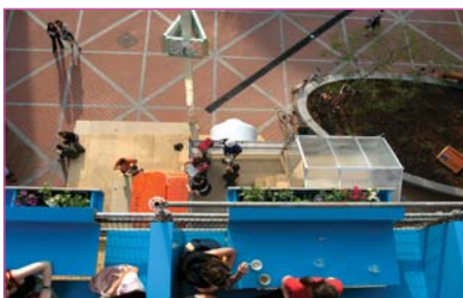
Add-on: Wallensteinplatz Viena (2005) http://www.add-on.at/cms/cat17.html?sid=5687a5d422681a5345e9e3c27a06fcac

residenciales y de habitar. Queremos entender como define la gran escala la vida humana y la tradición de habitar, para encontrar una respuesta firme. En este trayecto no podemos dejar de lado la visión más general, ni el enfoque analítico hacia la pequeña escala. Hay que entender la transición de la historia del hombre moderno (que también fue el origen de la célula de habitar) hacia la del hombre que crea la vida contemporánea. Un cambio cultural que ha sido denominado de muchas formas, pero que sin duda sigue en proceso y se refleja físicamente † tal como ocurrió con muchos cambios culturales anteriores † en la ciudad, el nudo espacial que absorbe la complejidad de la sociedad y expresa su ideología y costumbres en las diversas capas que componen el espacio urbano.