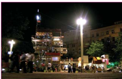
Add-on: Wallensteinplatz Viena (2005) http://www.add-on.at/cms/cat17.html?sid=5687a5d422681a5345e9e3c27a06fcac