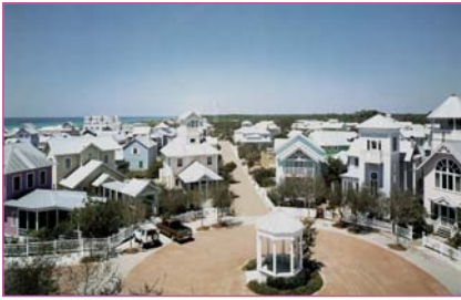
Celebration, Florida Archithese, Internationale Zeitschrift und Schriftenreihe für Architektur, pag. 43