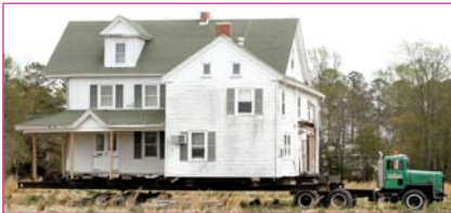
Trasporto estandarizado de casa unifamiliar Archithese, Internationale Zeitschrift und Schriftenreihe für Architektur, pag. 53