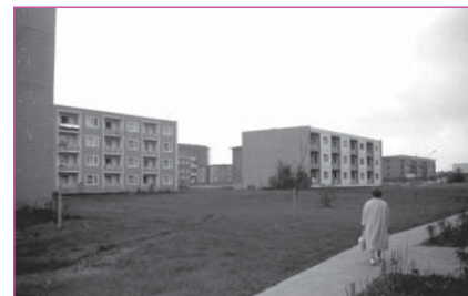
Siedlung Hohenhorst, Hamburgo (1960)

Se pretende desarrollar un trabajo que analiza la vivienda en relación con el desarrollo socioeconómico y cultural, para definir un nuevo enfoque en la construcción de espacios