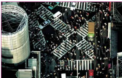
Paso de cebra en Tokio