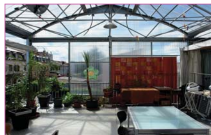
Lacaton & Vassal: Viviendas en Mulhouse (2005) http://www.lacatonvassal.com/index.php?idp=19