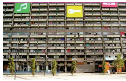
Raumlabor: Kolorado Halle-Neustadt, Berlin (2002-2005) http://www.raumlabor.net/?p=76

Líneas espacio físico: La posición del arquitecto La escala arquitectónica y los elementos estructurales La escala interior y mobiliario