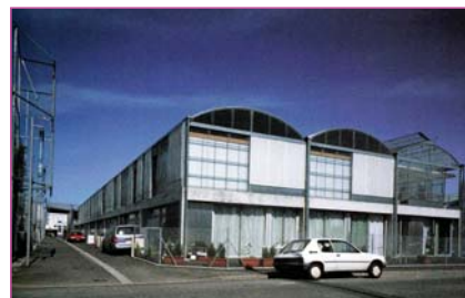
Lacaton & Vassal: Viviendas en Mulhouse (2005) http://www.lacatonvassal.com/index.php?idp=19