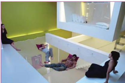
The cell, Alexander Brodsky (2008) http://notforfall.blogspot.com/2010_07_01_archive.html