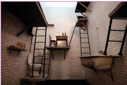
Maison NW, Nathalie Wolberg (2004) http://cubeme.com/blog/2010/03/04/maison-nw-by-nathalie-wolberg/