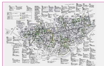
Raumlabor: Kolorado Halle-Neustadt, Berlin (2002-2005) http://www.raumlabor.net/?p=76