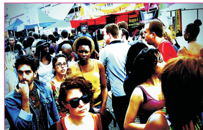
fuelle: Natália De' Carli